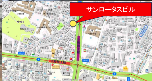
サンロータスビル

東京メトロ丸ノ内線 中野坂上駅 徒歩 2分 都営大江戸線 中野坂上駅 徒歩 2分